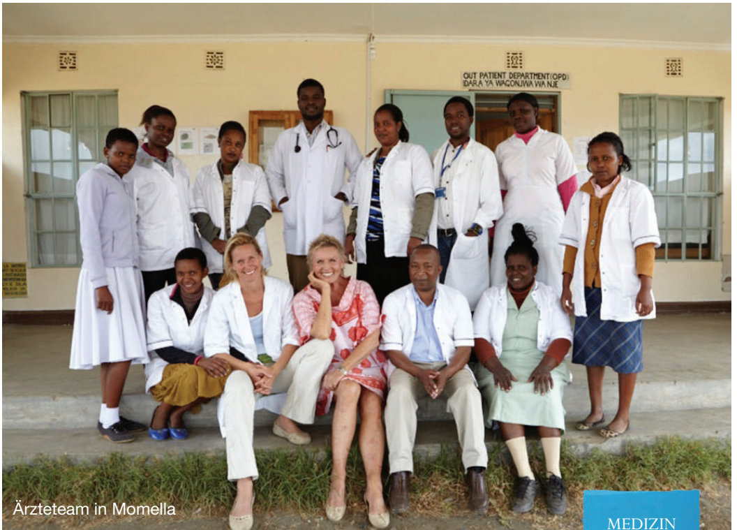
Ärzteteam in Momella